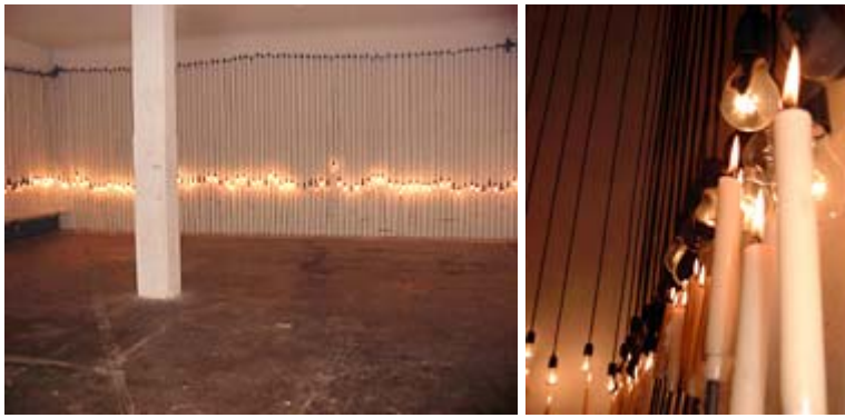
Stadttheater Bremen Bühne zu Tannhäuser von R. Wagner Regie: Tilman Knabe (Premiere: 27. März 2004)